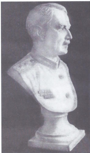
Бюст В.Н. Шевкуненко на его могиле на Богословском кладбище Санкт-Петербурга

ряна, и их пришлось восстанавливать, из-за чего атласа был опубликован в 1949 г.