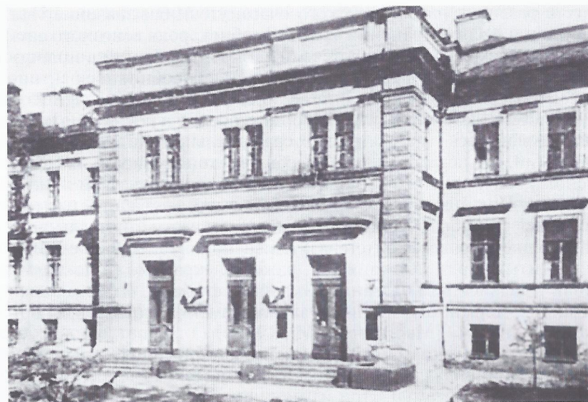
Анатомическое здание, где расположена кафедра оперативной хирургии и топографической анатомии ВМА в Санкт-Петербурге на ул. Лебедева