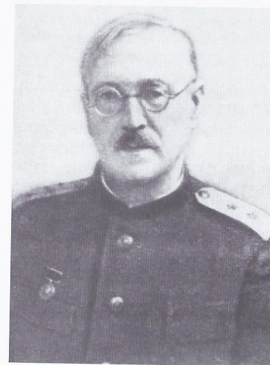
Портрет В.Н. Шевкуненко конца 40-х годов

Среди огромного количества работ В.Н. Шевкуненко особое место занимают монографии, атласы, учебники и руководства. «Типовая и возрастная анатомия»; «Курс оперативной хирургии с анатомо-топографическими данными» в 3 томах выдержали 3 издания; «Типовая анатомия человека», «Краткий курс оперативной хирургии с топографической анатомией» в 1 томе — 3 издания; «Курс топографической анатомии» — 3 издания; «Учебные операции на животных»; «Атлас периферической нервной и венозной систем». Составители атласа В.Н. Шевкуненко, А.С. Вишневский и А.Н. Максименков были удостоены Сталинской премии I степени. Постановление Правительства о присуждении премии за подготовленный к изданию атлас было принято в 1943 г., премия была вручена в Москве в том же году. Во время войны часть рисунков была уте-