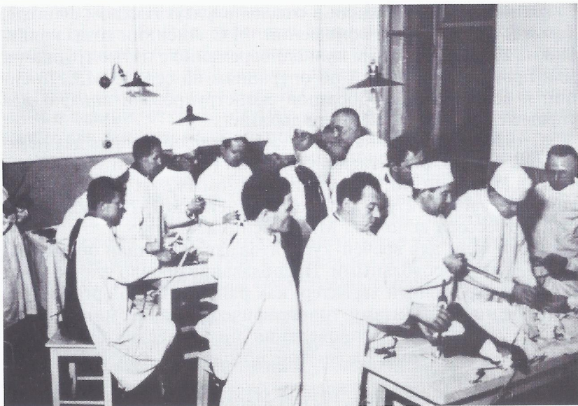
Практические занятия врачей-хирургов по оперативной хирургии в ЛенГИДУВе

относятся к прикладной анатомии с оперативной хирургией, что на занятия ходят свыше 100%, т. е. приводят с собой товарищей или сами являются повторно. Не на мои занятия (я далек от похвалы), а к моим сотрудникам. Это зависит даже не от личностей. Вот кто ценит предмет — хирурги: у каждого из них всегда есть свои вопросы и думы, которые они хотят разрешить тут же на занятиях. Это аудитория — большого класса», — писал В.Н. Шевкуненко в 1935 г.