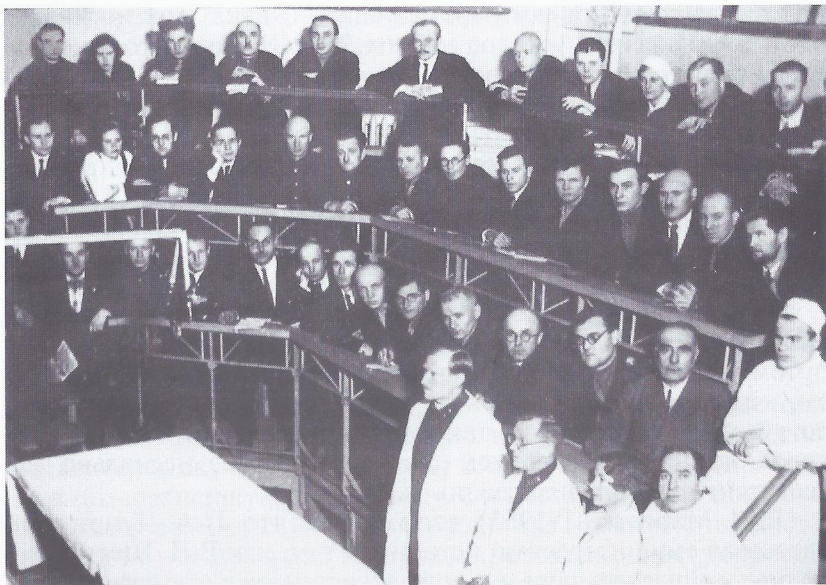
Профессор В.Н. Шевкуненко в аудитории-секционной перед показательной операцией