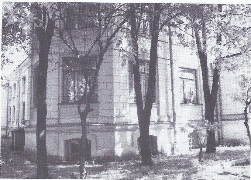
Анатомо-гигиенический корпус ЛенГИДУВа